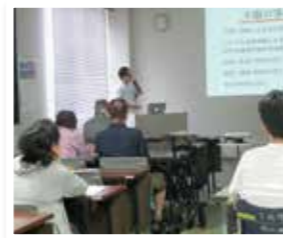
R1年9月 「高齢者の頭部外傷」 副院長・脳神経リハビリテーション科 紀 武志