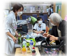
糖尿病カフェ(同時開催)